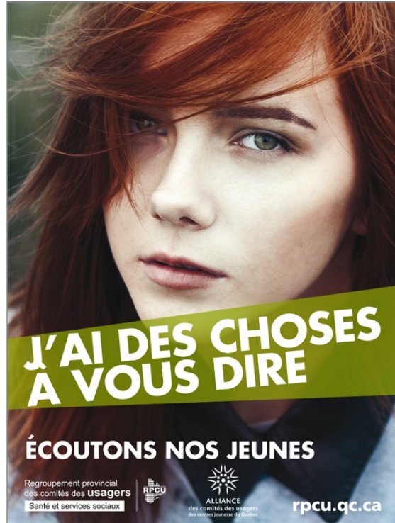
Campagne du RPCU Écoutons nos jeunes J'ai des choses à vous dire